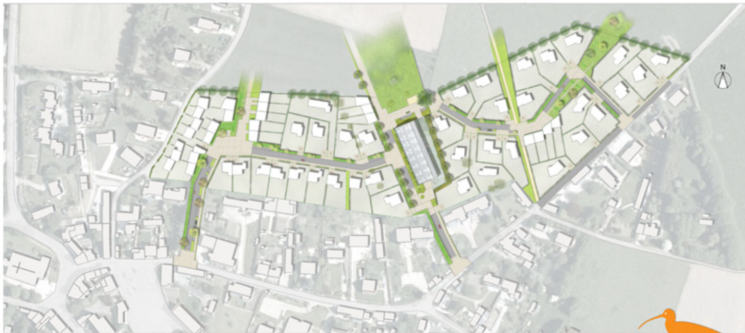
Plan de composition d'ensemble