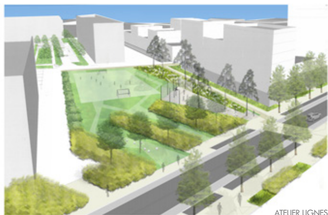
PERSPECTIVE D'AMBIANCE DE LA PLAINE DE JEUX

La qualité des aménagements entraîne un effet de valorisation de chaque usager permettant l'identification, au même titre que la présence végétale qui participe à l'apaisement des ambiances. C'est par cette dimension sociale et culturelle de l'espace public que le projet est traité, dans le respect des traces de l'activité portuaire passée.